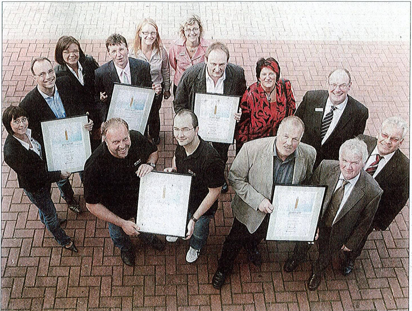
Die Inhaber und Ausbildungsbeauftragten der fünf ausgezeichneten Betriebe halten stolz ihre Zertifikate in die Höhe.